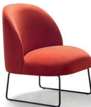
▲ VILM 1PM