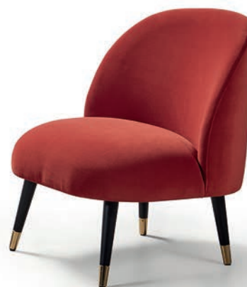
▲ VILM 1P con casquillos. VILM 1P with metal casing. VILM 1P avec sabots.